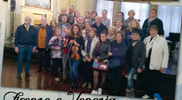
Firenze e Venezia