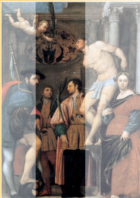
Pomponio Amalteo: Sacra conversione con i Santi Sebastiano, Rocco, Apollonia, Cosma e Damiano